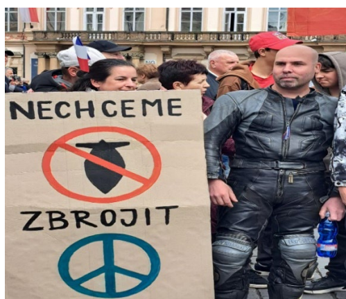
Obr. č. 1 a 2: Demonstrace na Staroměstském náměstí v Praze dne 8. 5. 2025 s názvem Česko proti válce.